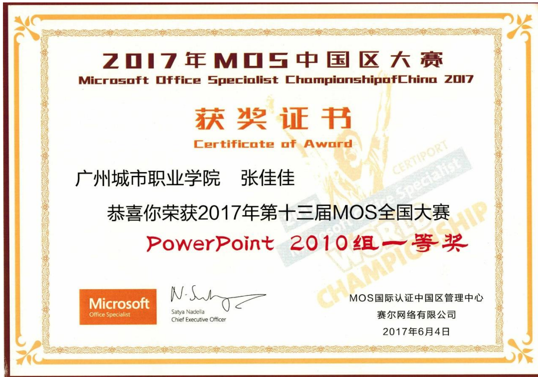
图 5、学生参加 MOS 大赛获奖证书 2