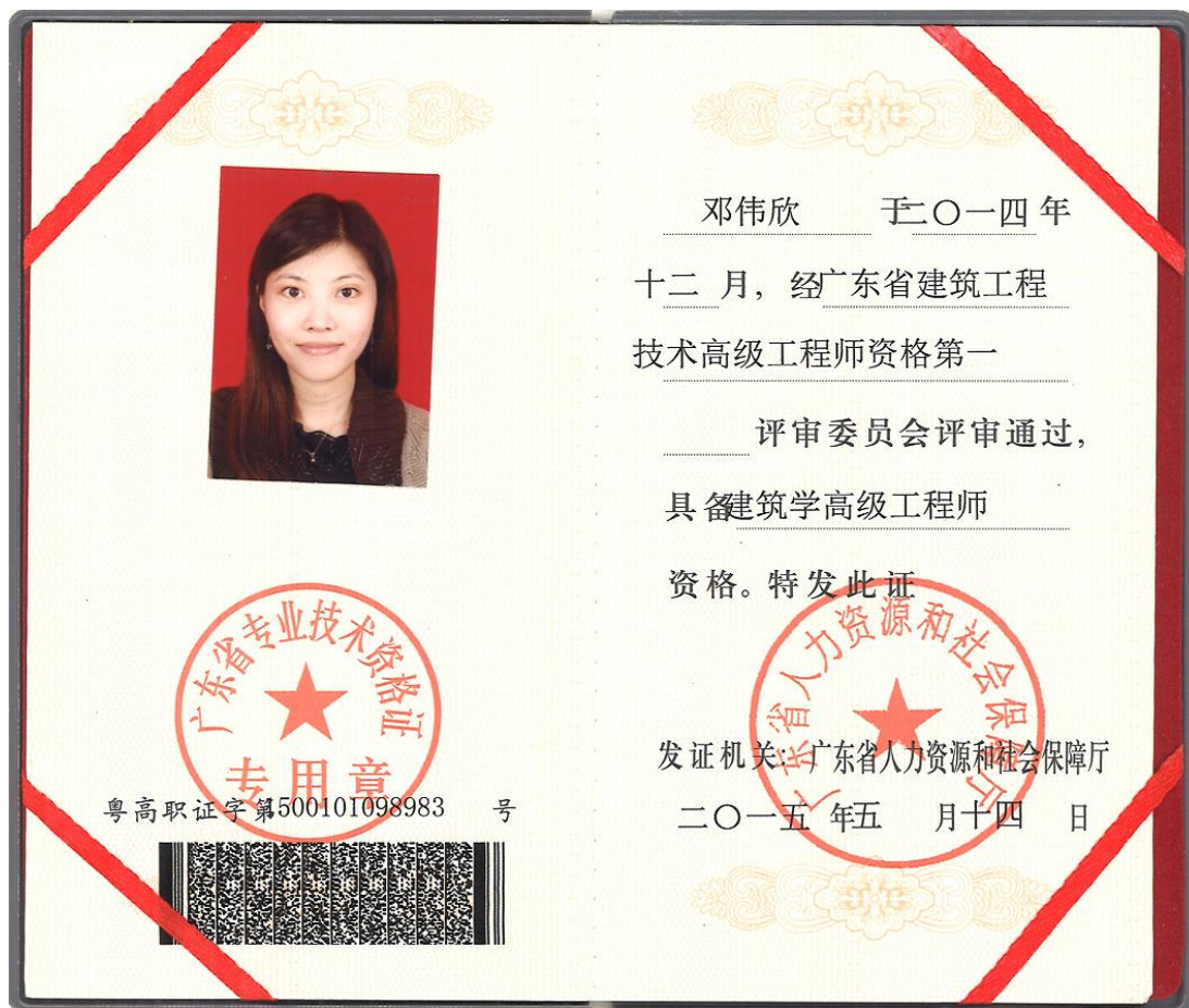
高级工程师职称证书