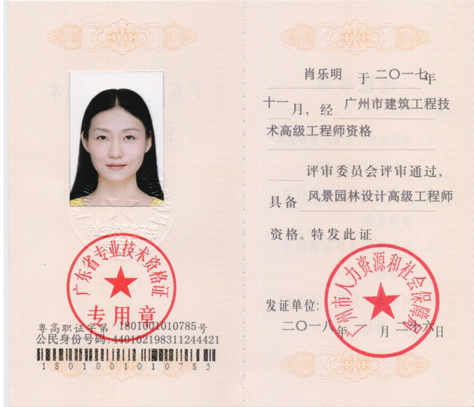
高级工程师职称证书