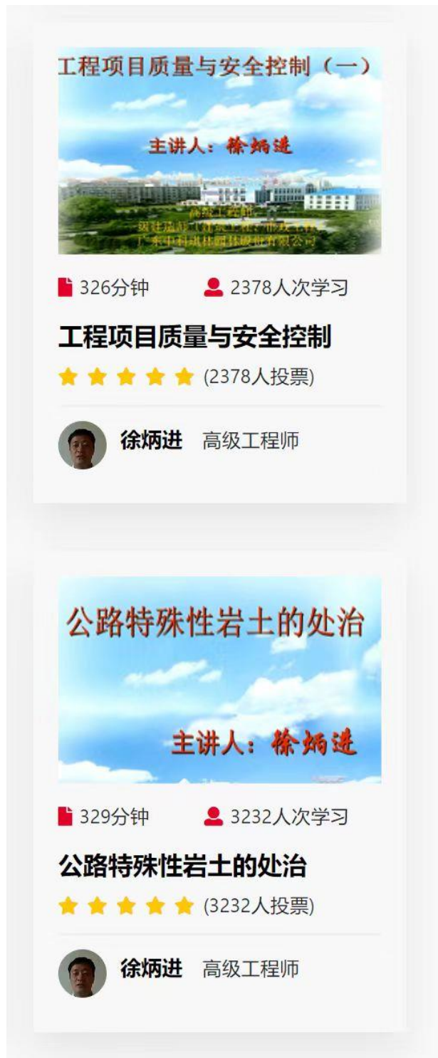
图 2.1.4-3 工程项目质量安全控制 (一) 及公路特殊性岩土的处治的培训记录