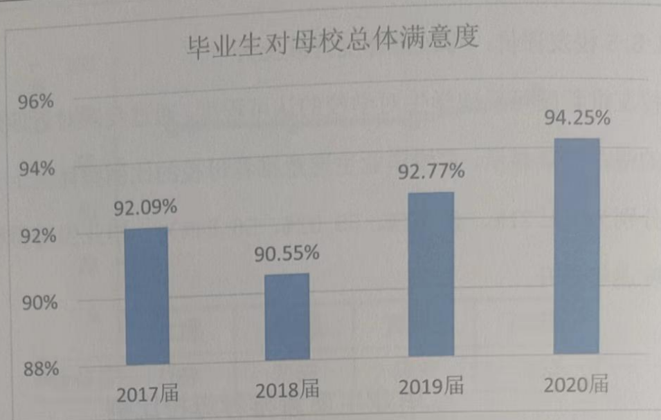
图 2-11 连续四届毕业生对母校满意度