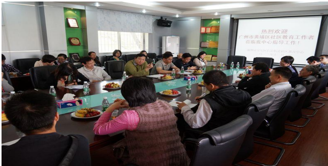
学员在深圳宝安区石岩街道社区教育中心认真听取先进工作经验