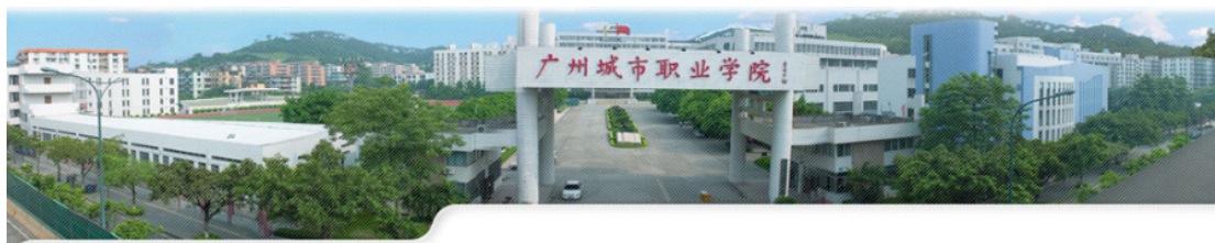
第二届广州（国际）城市影像大赛巡展成功举行（图文）