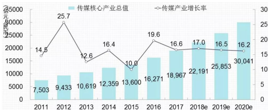
图 1-3 中国传媒产业市场发展预测

中国老百姓们更倾向于选择健康、绿色、环保的生活方式，恩格尔系数降低体现出人们日益增长的消费需求，预计2018年中国居民消费增长还将加快，文化传媒消费继续稳步提升，从而带动传媒产业持续增长。互联网重构了传媒产业，使产业边界不断延展，产业规模快速增长，传媒业未来五年预计还将保持两位数增长，预计2020年有望突破3万亿，行业整体对新媒体人才的需求旺盛。