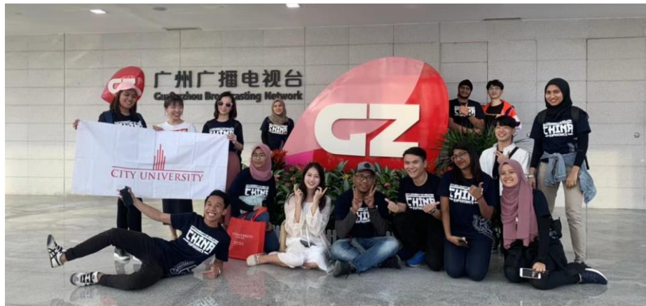
图 2-3 国际办学合作方马来西亚城市大学参观广州国际媒体港