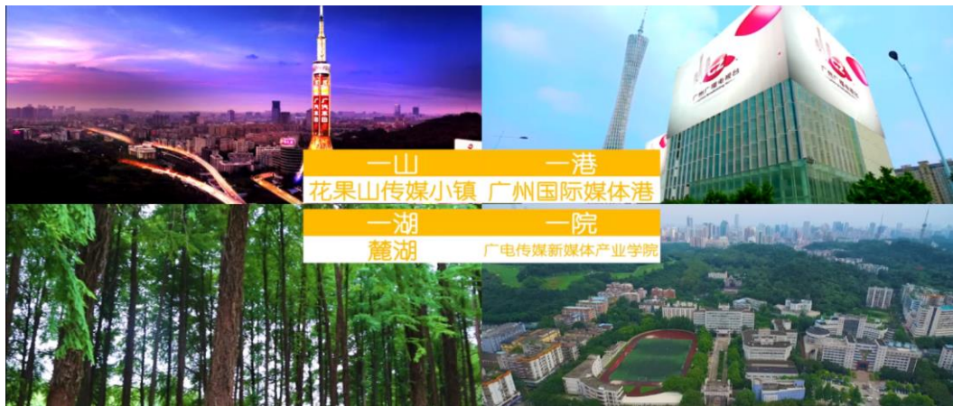
图 2-1 “一山一港一湖一院”产教融合战略

以广州市广播电视台“一山一港”(花果山+媒体港)、广州城市职业学院一湖一院(麓湖+集团传媒学院)为依托,以产教融合的模式,精准培养,根据需要培养职业人才,以现代学徒制的方式,通过实训、实践、实习对接广州国际媒体港国际广告产业园区、花果山传媒小镇进驻企业的相关岗位需求,形成招生、培养、就业全贯穿,精准对接企业用人需求,按企业需要精准育人,实现校企育人“双重主体”,学生学徒“双重身份”,实现学院与企业联盟、与行业联合、同园区联结,实现工学结合、校企双制、工学一体。