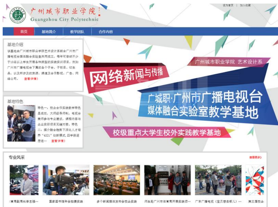
图 2-4 广城职·广州市广播电视台媒体融合实验室教学基地网站

2014 年由广州城市职业学院艺术设计系联合广州市广播电视台媒体融合发展中心共同申报成立了校级大学生校外实习基地。该基地作为强大的校企合作实习平台已经彰显出它实力,该基地连续 4 年在寒暑假期间开放让学生实习受益,每年开展各种类型的实践实训项目。