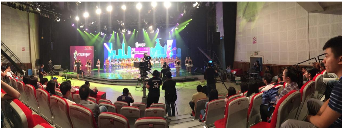
图 2-2 广电传媒集团厂中校

（1）在广州广电传媒集团及下属企业建设“厂中校”作为学生学业实践基地，配合学校安排、指导毕业生的实习，并为学校学生的专业实习和社会实践提供方便。