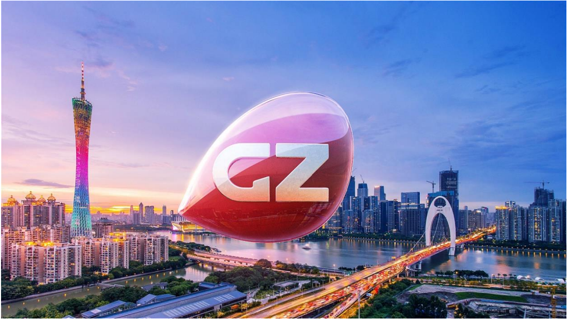
图 1-1 广州广电传媒集团

广州广电传媒集团是广州市广播电视台根据文化体制改革的精神，按照广州市委市政府有关广州市文化体制改革的部署，结合广州市广播电视台的实际情况注资组建，“台控、台属、台管”的广播电视传媒产业运营实体。集团业务包含广播电视广告经营管理、综艺文化传播、新媒体业务、电视购物、物业产业经营管理等方面，着重于战略管理、投资管理、广播电视广告经营，主要从事战略规划、资产管理、投资管理、财务管理、人力资源、战略资源优化配置、广告经营、业务组合协调发展。主要资源有：（1）广播电视节目制作所需的设施、技术保障；（2）广播电视节目采编、制作、播出平台；（3）一批优秀的传媒艺术教育资深导师，实践经验丰富、专业素质优秀的高层管理人员和高级编辑、记者、