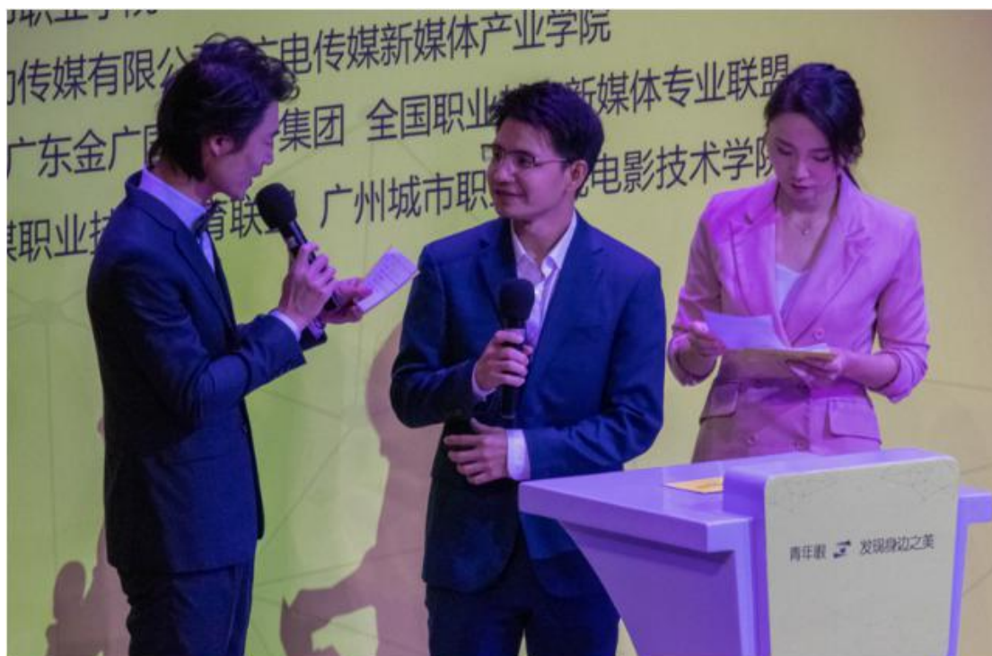
第33届金鸡奖最佳儿童电影导演谢德炬颁发最佳导演奖