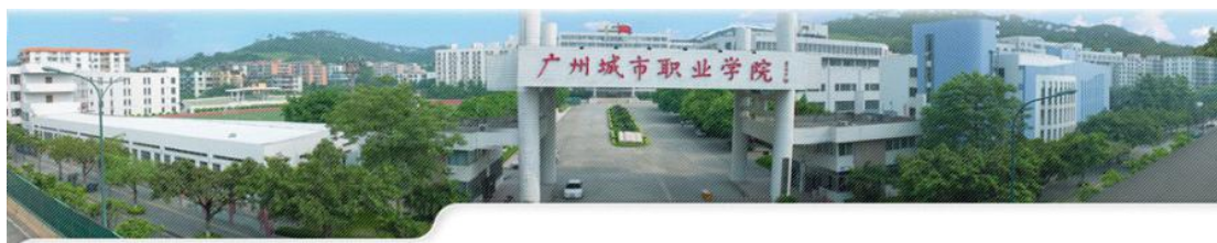
第三届广州（国际）城市影像大赛正式启动（图文）