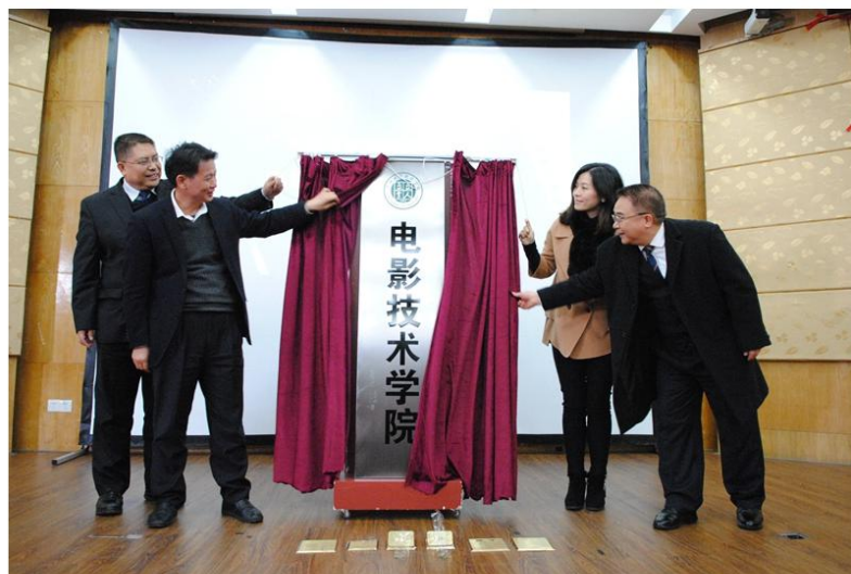
电影技术学院成立