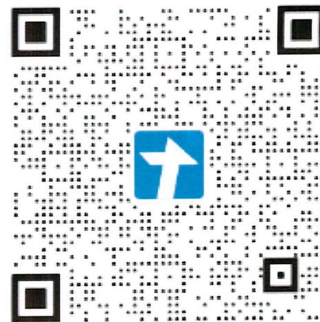
高层次技能型兼职教师