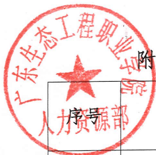
附件 1: 2023 年省高等职业教育教学质量与教学改革工程 (教师类) 推荐项目名单