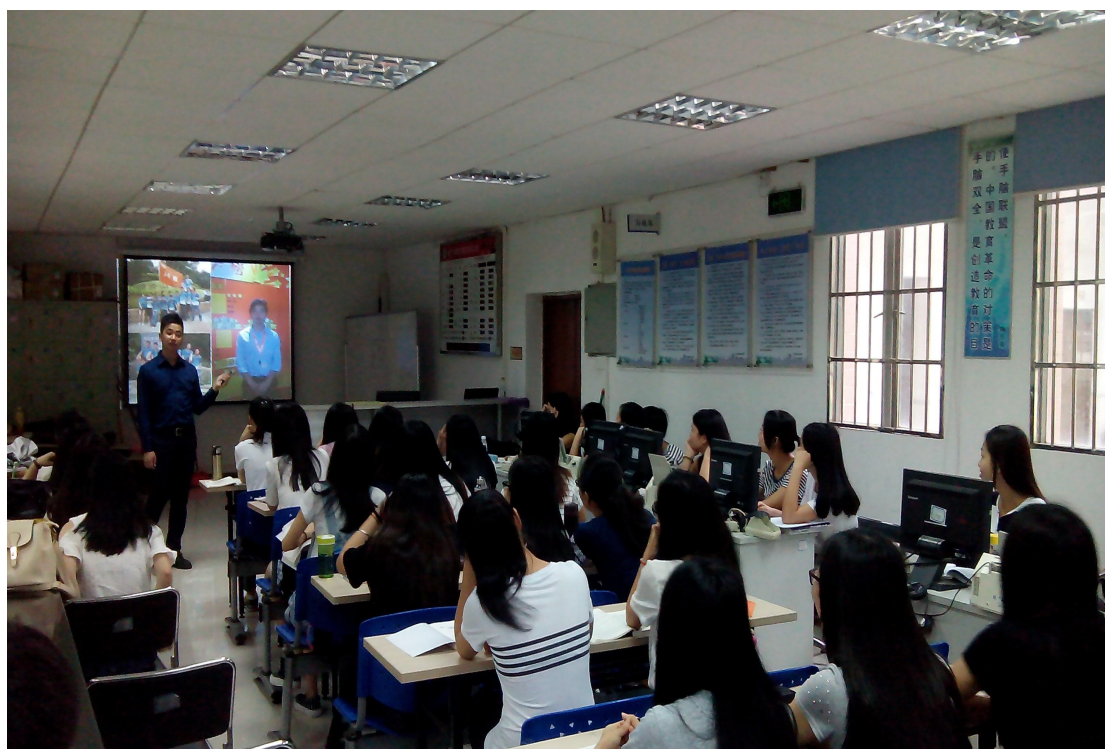
图 3：郑经理在分享自己的成长经历