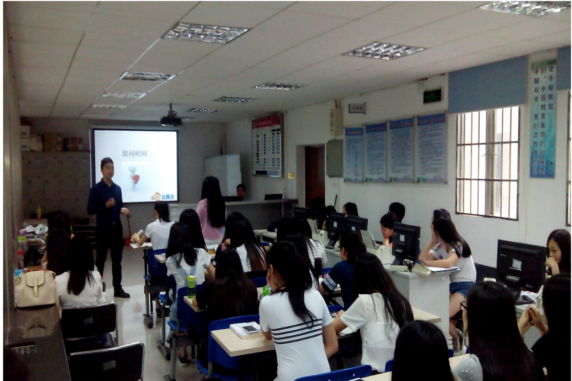
图 4：郑经理与学生互动