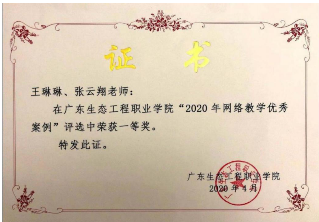
图 8：2020 年《AutoCAD》网络教学优秀案例一等奖