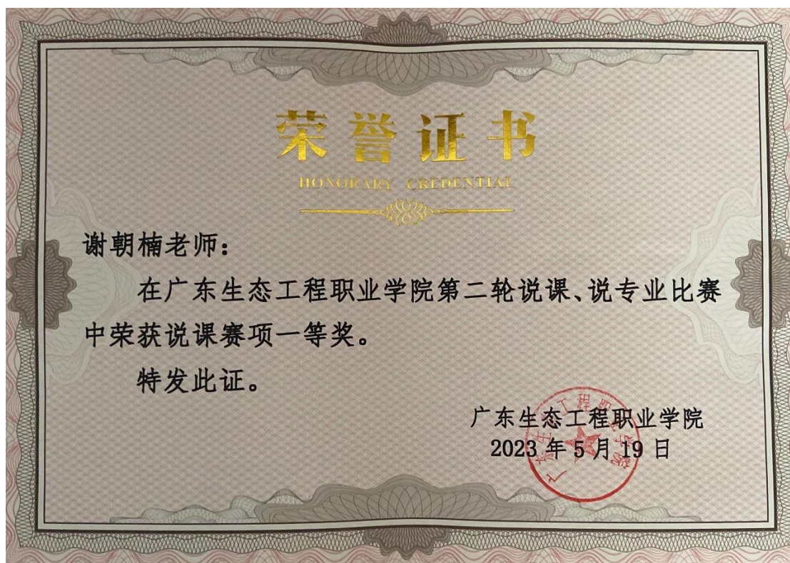
图 12：2023 年广东生态工程职业学院说课说专业比赛（校级）